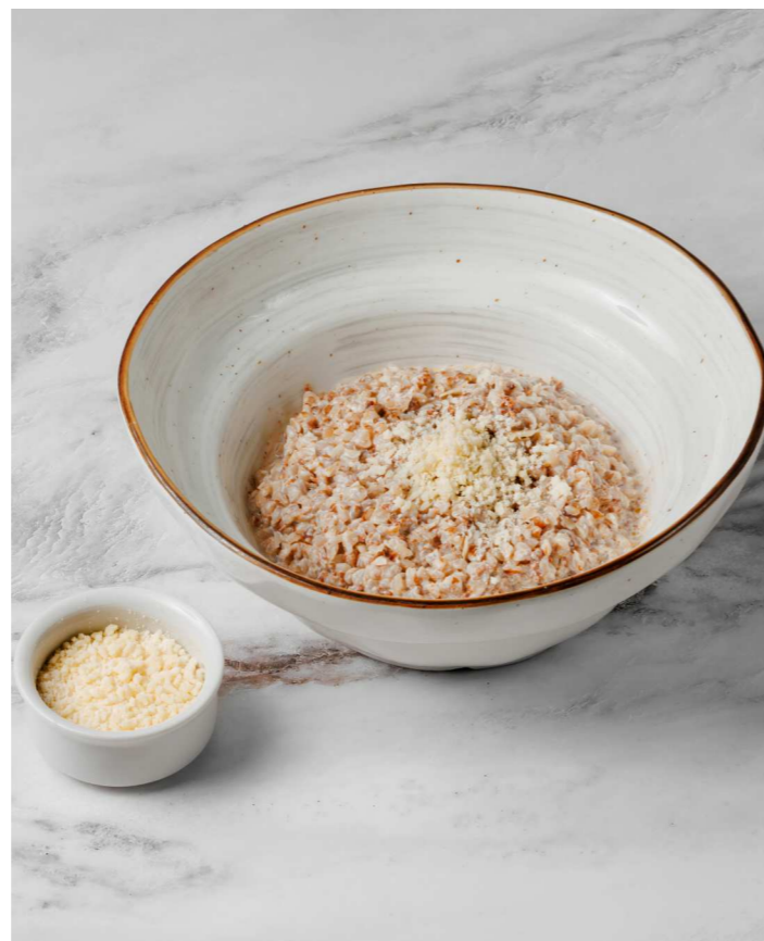
Гречневая каша с пармезаном 350 Р