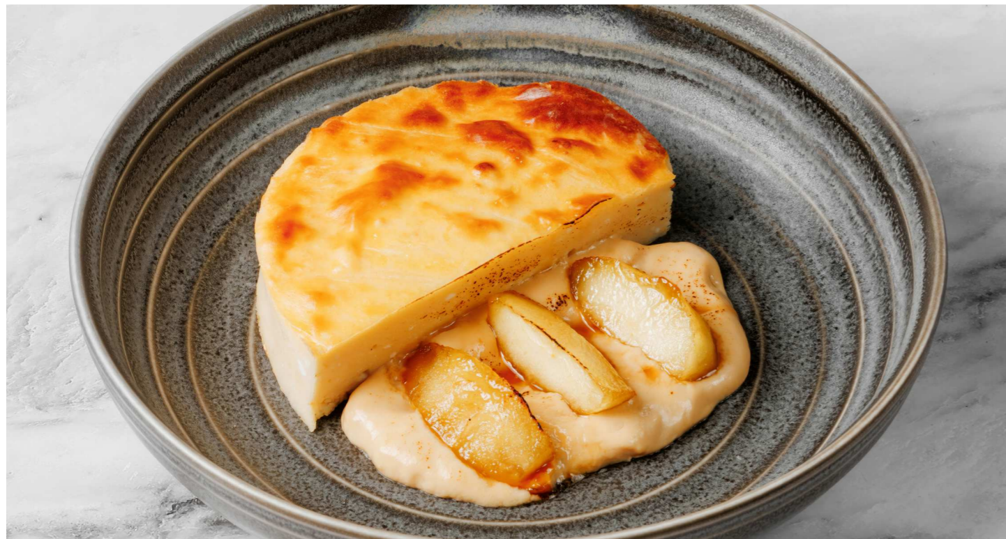
Творожная запеканка с яблоком 420 Р