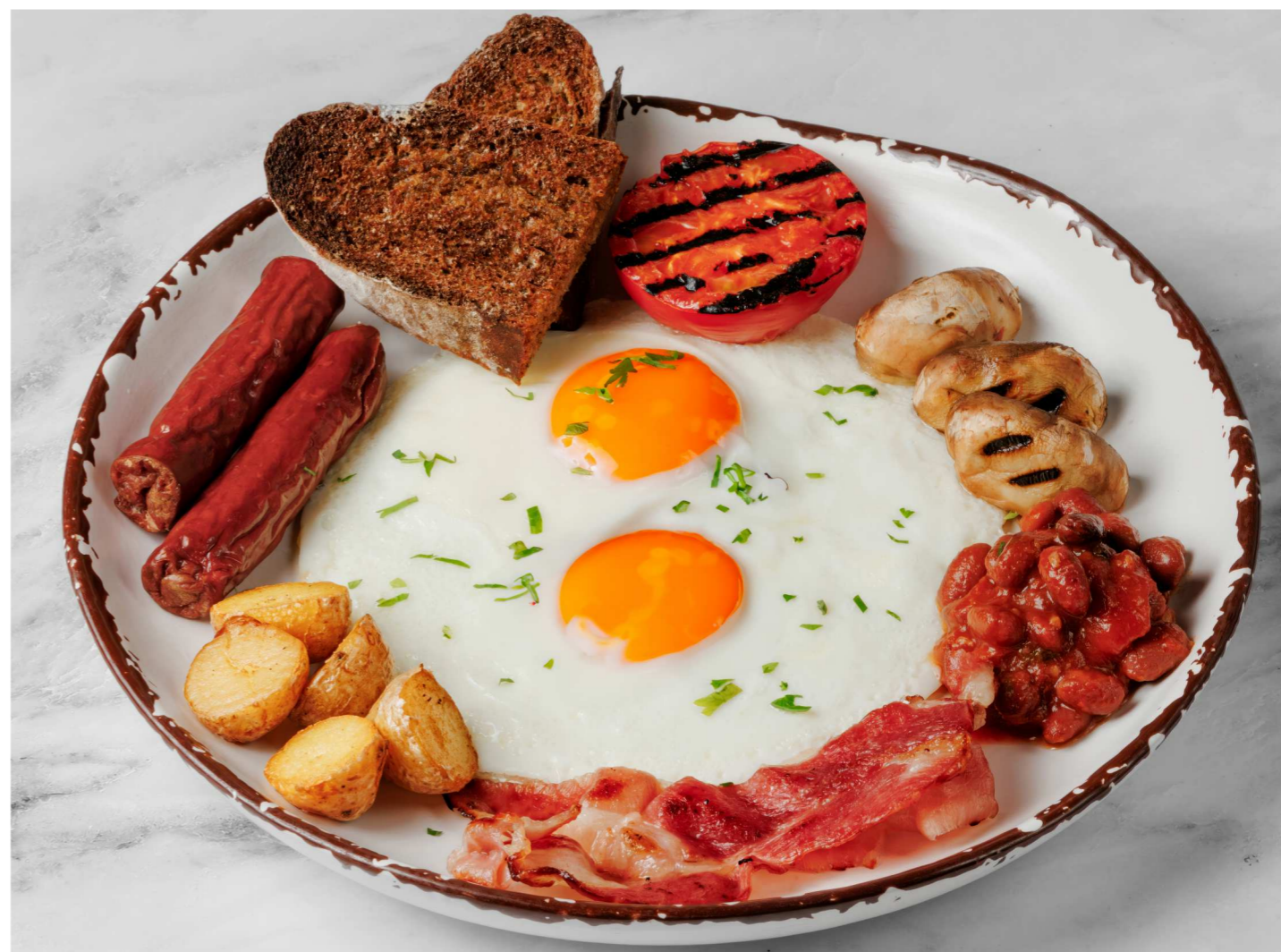
Английский завтрак 590 Р