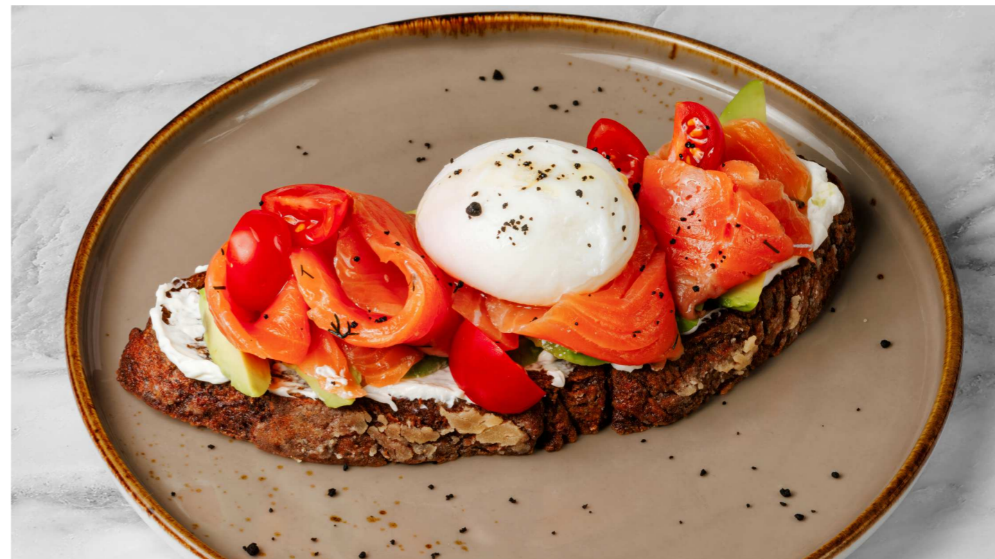
Бенедикт с лососем с/с, гуакамоле и томатами 590 Р