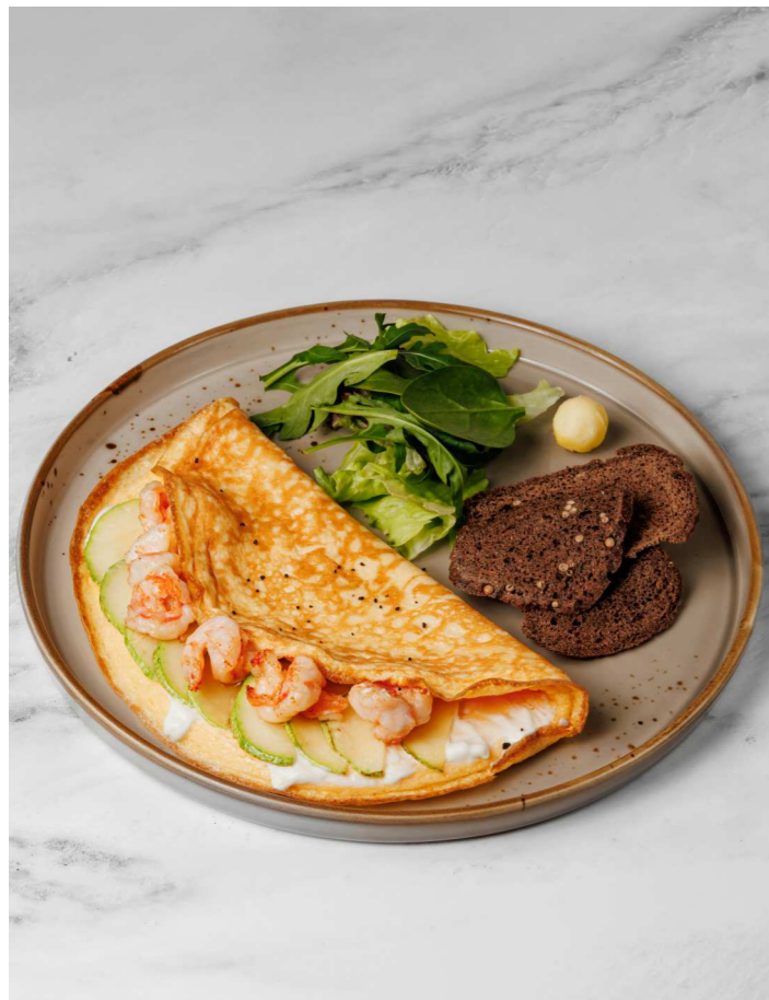
Омлет с креветкой и цукини 590 Р