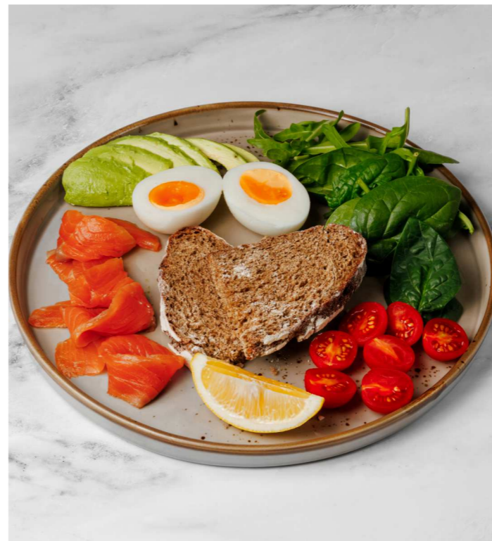
Легкий завтрак 790 Р