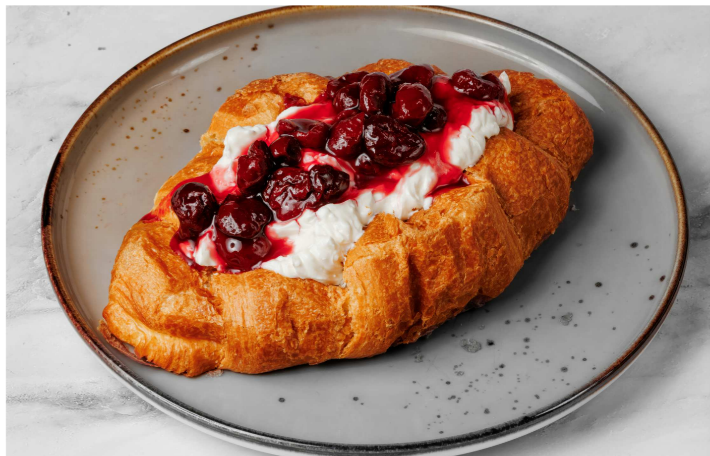
Круассан с вишней 350 Р