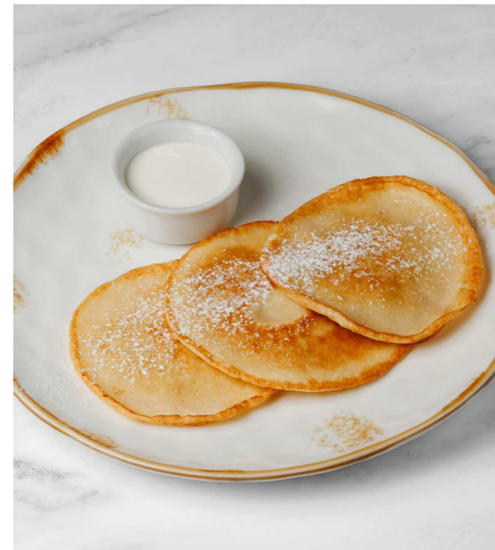
Оладьи со сметаной 250 Р