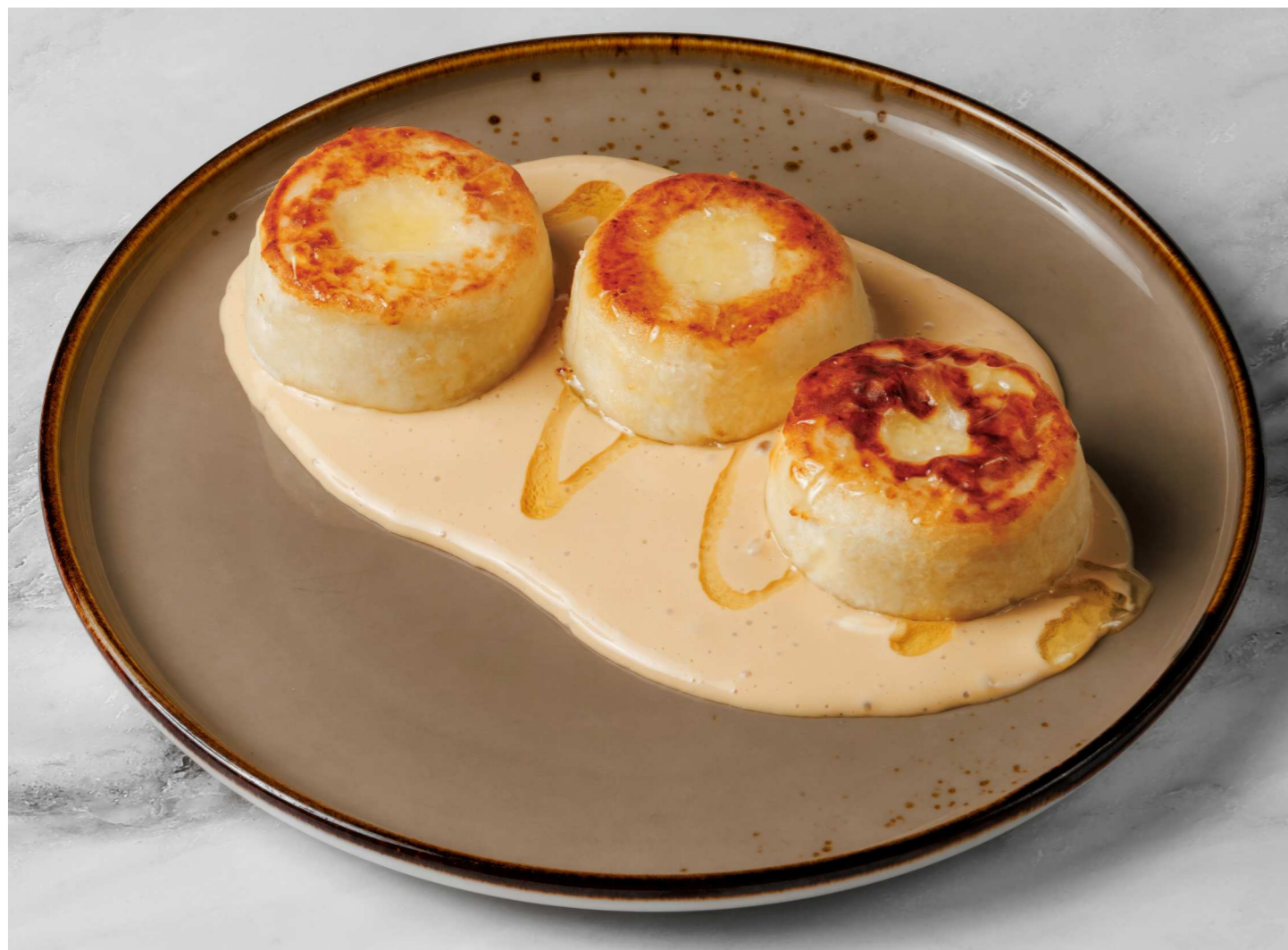
Сырники 490 Р