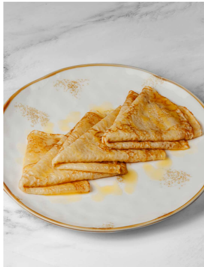
Блинчики с маслом 290 Р