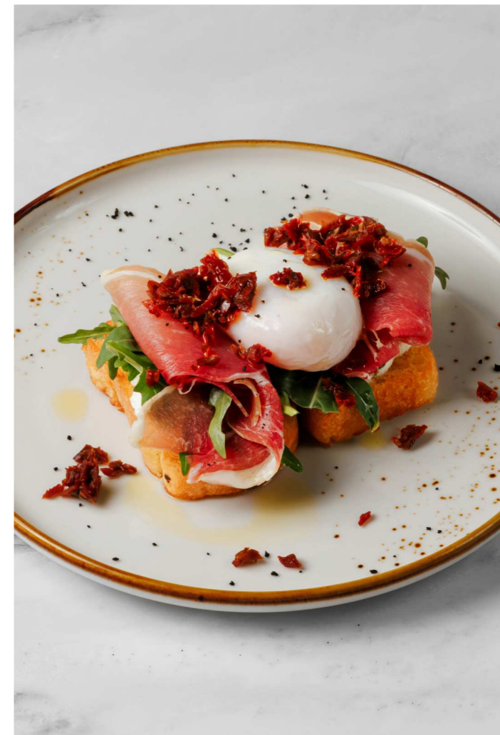
Бенедикт с пармой 650 Р