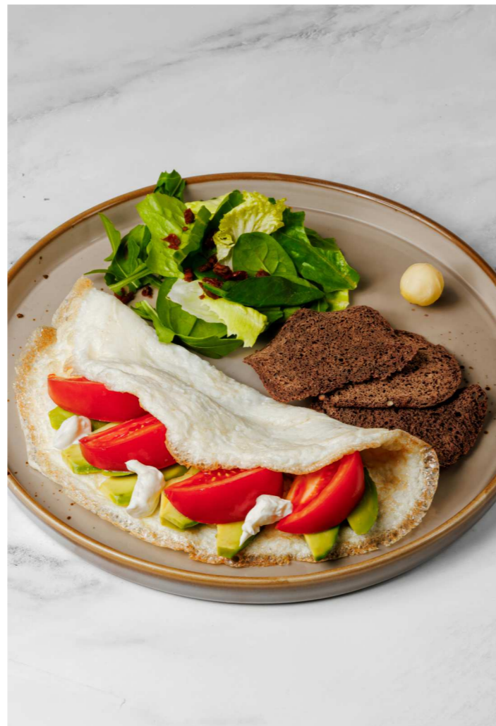
Белковый омлет с томатами и авокадо 550 Р