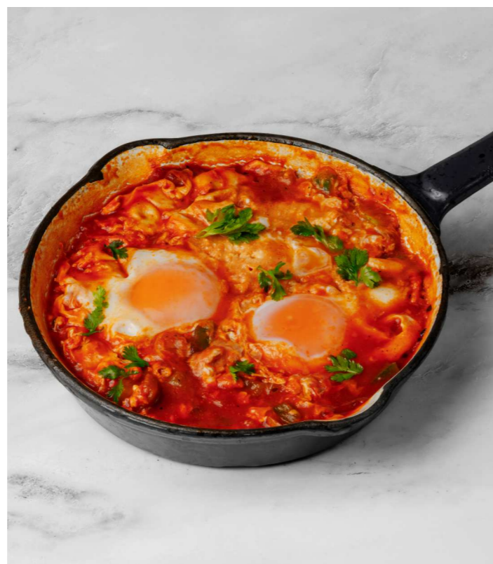
Шакшука 450 Р