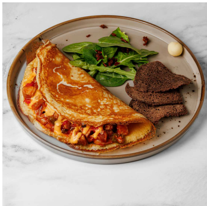
Омлет с курицей 550 Р